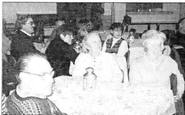
Ambiance auberge morvandelle à la salle des fêtes