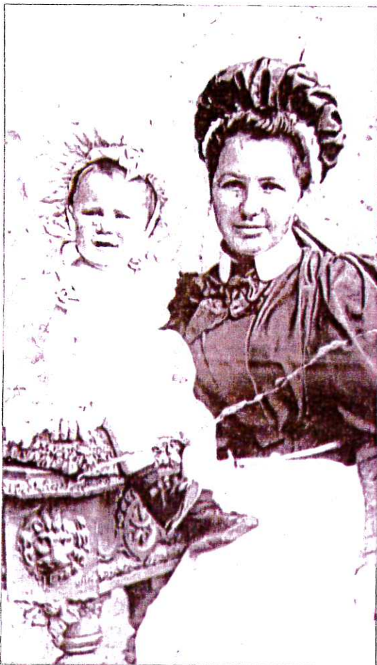
Pendant toute la durée des représentations du Lait de Marie, une exposition consacrée aux « nourrices sur lieu » sera proposée au public dans une salle de la mairie de Saint-Germain-de-Modéon.